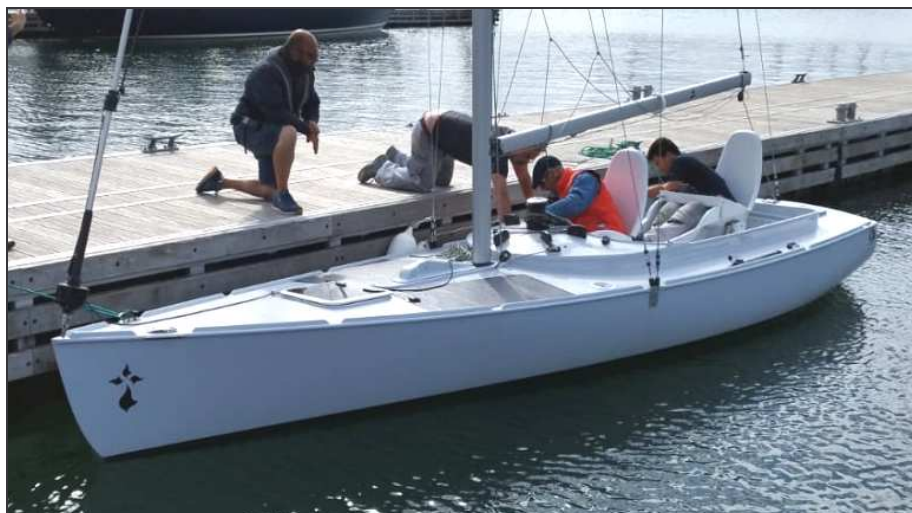
Mise à l'eau le 17 juillet 2024 à la Trinité-sur-mer.

l'opérateur se tient à bord, directement impliqué.